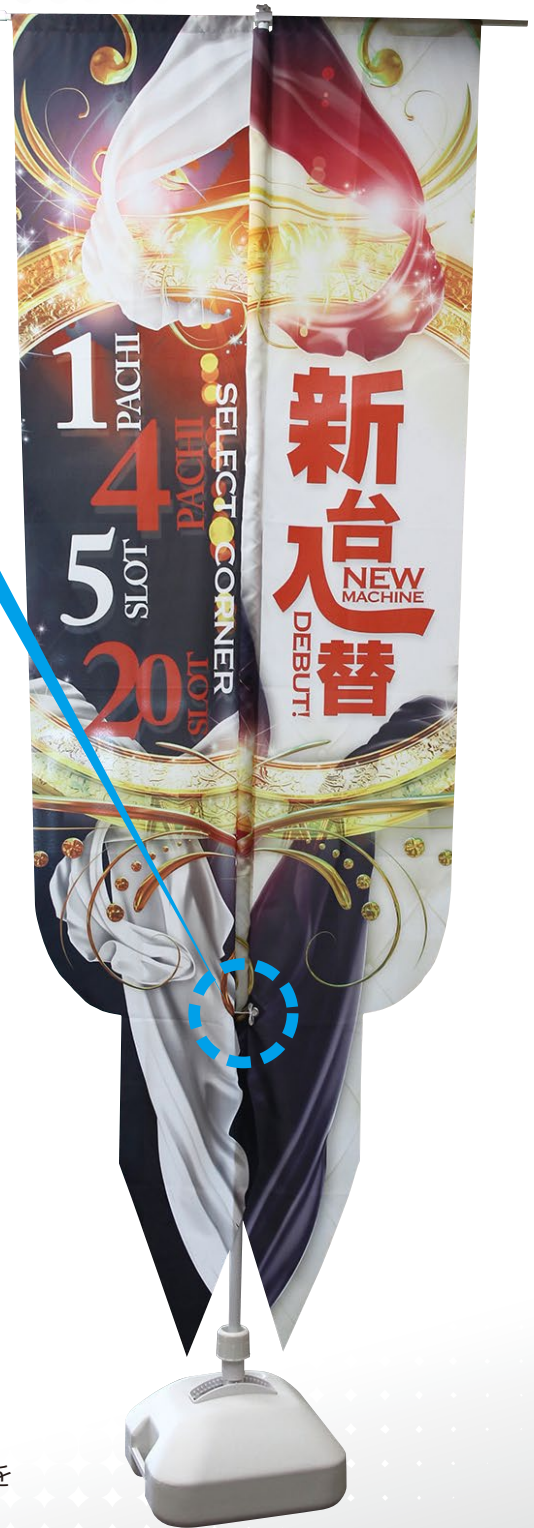
※サンプルデザイン C077-2