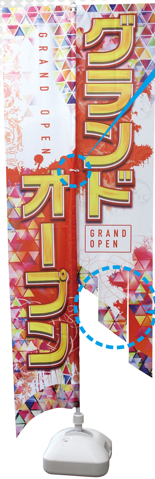
※サンプルデザイン C077-1